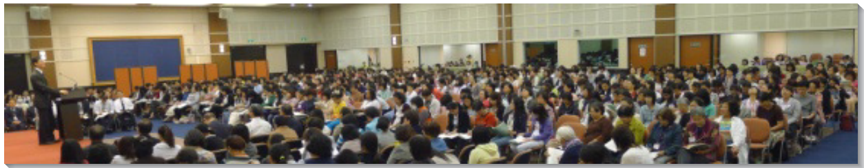
▲姊妹們專心聆聽會中信息