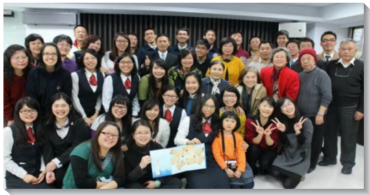
▲聖徒與配搭叩訪之學員合影

今年初，三十六會所整建完成後，眾聖徒同心合意宣告，要帶領五十個人得救歸主，成為主在關渡這地的見證。我們藉著彼此相愛，剛強開拓，興旺福音。接著，有十一位全時間訓練學員接受帶領，來到關渡忠義附近開展，眾聖徒一同配搭，週週叩門，天天接觸人，短短五週的開展期間，藉著眾人同心合意的配搭，結了四十三個果子。