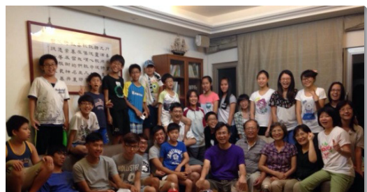
▲青少年邀約同學、朋友至服事者家中聚集