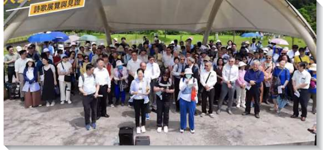
▲各大區聖徒們至南港相調

相調先有詩歌展覽，也有召會生活的見證，在過程中眾人們靈裏高昂，彼此歡唱詩歌並交通，各大區輪流上台有秩有序。結束時聖徒們同聲呼喊『哦主，阿們，阿利路亞，主耶穌阿！我願你來！』。弟兄用詩篇九十章一節鼓勵聖徒們，『主阿，你世世代代作我們的居所』。不論我們年紀如何，在召會中，在神的殿裏都是有用的，特別是長青聖徒們，是召會中最有用的一班人。長青聖徒能有分牧養，能把家打開，還能為眾聖徒