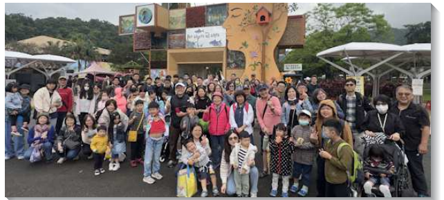
▲聖徒們與福音朋友喜樂外出相調

此外，規劃本次親子相調的另一個負擔，乃是盼望帶進更多家長與孩子進到兒童排。我們看見『兒童是一個大的福音』，是使召會生活人數增加，最容易達到、也最扎實的路。藉由這樣的出外活動，和一個個家建立起關係，並在過程中和他們傳輸、分享兒童排的豐富以及對家庭生活的益處，盼望他們能看重、積極參與