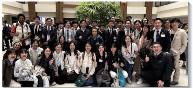
▲全台大學外語生相調特會在中調舉行

這次聚集有兩篇信息，第一篇交通到『享受基督作生命樹』。我們要喫基督作生命樹，就必須在凡事上讓基督居首位，就是以起初的愛來愛祂，受祂愛的困迫，在我們的生活中以祂為一切，接受祂作一切。弟兄們鼓勵我們每一位都要愛主耶穌，每天以最上好的愛來愛祂。享受的路就是清早起來，第一件事先呼求祂的名。藉著呼求，我們就喫祂，並以祂為我們的生命，並因祂活著！第二篇信息交通『召會作耶穌見證乃是七個金燈臺』。金燈臺象徵三一神：父是本質，化身於子，子是具體化身，藉靈彰顯，靈則完滿的實化並彰顯為眾召