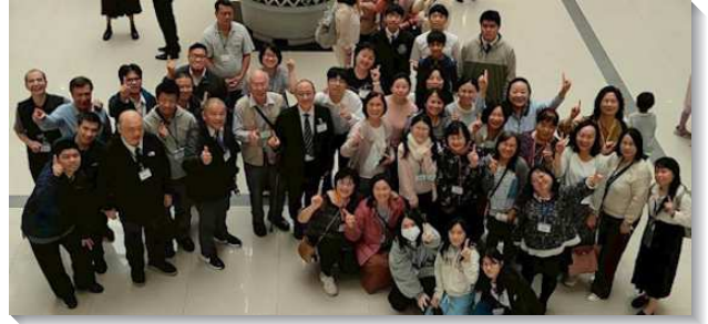
▲聖徒們參加神命定之路成全訓練

訓練信息，帶領眾聖徒要恢復使徒行傳挨家挨戶的召會生活，『家』實在是神命定之路實行的命脈，是福音的出路，是生命站、真理站、福音站、牧養站，也是召會生活站。鼓勵聖徒家家都要打開，開職場排、校園排、青職排、主婦排、社區排等。眾聖徒也領受這樣的負擔，紛紛響應開家的呼召，因為開家不只幫助我們生命長大，也使救恩到了打開的家。此外，開家聖徒的見證分享，激勵眾聖徒，願意更新奉獻，不只自己的