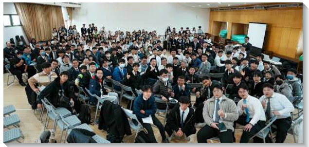
▲文山一大區及信基大區青少年寒假特會

願主保守每位弟兄姊妹，帶著這次特會的供應和奉獻，在新學期的生活中，在校園與召會中繼續燃燒，作主的見證人，直到祂的再來！（鍾孟豪、蔡輝禧）