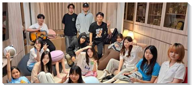
▲聖徒們配搭服事青少年排

與以往不同的，先前得榮少年的服事都以青少年服事者承擔，所能接觸的層面大多為青少年本人，以及主要照顧的家長，但是專項服事人力不足，對於少年家庭的聯結不易穩固。加上近幾年召會聖徒家中的兒童越來越少，本會所也面臨兒童斷層問題，於是在擴大得榮少年教育專案的帶領下，配合港湖大區大量的發送申請教育專案的傳單，從投遞社區的信箱、到學校、安親班、里長辦公室的單張發送。自去年暑假開始，陸陸續續收到許多家庭的回應，透過家訪接洽，我們得到六個家庭的有效名單，並願意繼續受接觸而有回訪。