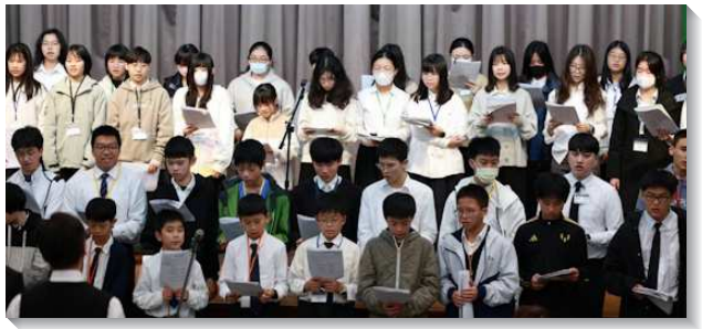
▲士林大區青少年寒假特會

此外，在這次特會期間，特別安排專題分享的時間，邀請一位甫考上會計師的弟兄和青少年分享他的見證。在分享的過程中，弟兄說自己並不是天資過人，但是藉著向主奉獻、禱告，設定明確的目標，以及善用零碎的時間，即使弟兄已經是兩個幼童的父親，還帶著職業，仍然考取極不易考取的專業證照。藉著弟兄的分享，激