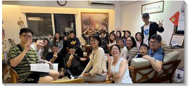
▲聖徒們享受排聚集受成全

在小排的交通中，我們除了研讀真理，更操練將主的話應用於生活中。有弟兄姊妹分享，在面對工作壓力與人際困境時，藉著馬太福音關於『先尋求祂的國』（太六33）的題醒，使心境從焦慮轉為平安，見證基督的生命超越一切環境。每位聖徒也發揮生機功