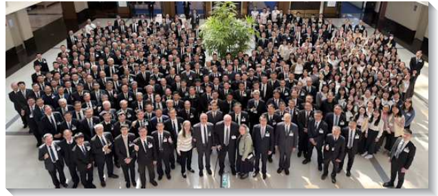
▲ 各地同工參加春季同工成全訓練

第三篇是『為著新的復興，被構成門徒過神人的生活，成為今日的得勝者』。神需要一班團體的人，藉著神聖啟示的高峰，憑著祂的恩典被興起來，過一種照著這啟示的神人生活。復興乃是我們所看見之異象的實行。我們若實行過神人的生活，這生活就是基督身體的實際，自然而然就會有團體的模型，就是活在神經綸裏的模型，這模型要成為召會歷史中最大的復興，把主帶回來。第四篇『照著主耶穌和使徒保羅的榜樣，憑顧惜與餵養而牧養人』，以完成神永遠的經綸。在神完整的