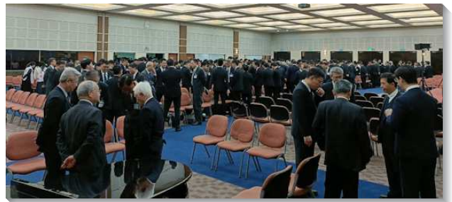
▲ 各地同工團體禱告

第五篇『藉著給聖徒屬靈洗腳的服事而牧養他們，好恢復他們屬靈的新樣、新鮮與活潑』。在約翰福音十三章所記載關於洗腳的事，乃是一個表號，具有屬靈意義的象徵。在我們的經歷中，腳的玷污指因著與世界接觸而產生與神並與彼此的隔膜；洗腳指恢復屬靈的新鮮與活潑，並恢復我們與主並彼此的交通。我們要經歷這種洗滌，就需要花時間在主面前，並與那些滿了那靈、話、和神聖生命的聖徒在一起。並且我們每個人都必須