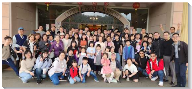
▲聖徒們喜樂參加新春集調

因著社區聖徒對學生有負擔，宣告今年要再增一個學生區，同時盼望成全更多青職聖徒一同配搭學生服事，人人付上代價，不惜遠距照顧，舉辦登山相調，用餐相調，加上追求屬靈信息，使青年人在生活中彼此作同伴，在各樣聚會中樂意盡功用，更在學生工作