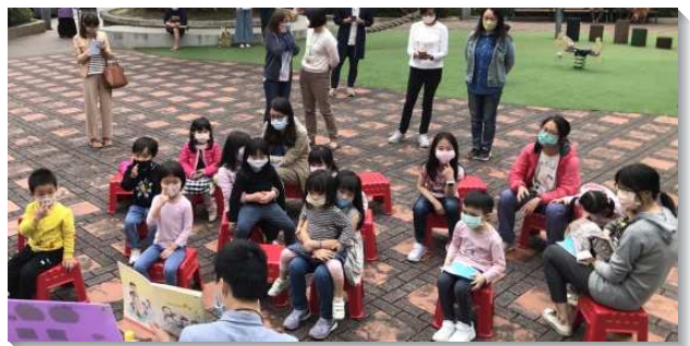
▲聖徒們配搭兒童公園福音小排

目前本會所的基數是一百零七位，然而在系統上的名單至少有二百八十六位。我們為這些待恢復的弟兄姊妹逐一列名禱告，或在禱告聚會或在小排中總不停歇，相信藉著我們的代禱祈求並加上家聚會牧養，主的愛必親自帶領聖徒回父家，享受家中的豐富。感謝主，聖靈作工，聖徒們學習同心合意配搭，相信主必增加召會的人數，成就祂的心意。（汪勝龍、林晉義）