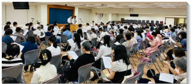
▲城中大區夏季現場訓練於一會所舉行

各會所聖徒們彼此邀約來到現場訓練，一同進入豐富的信息內容。許多會所的青年弟兄姊妹操練上台分享、考試、且有負責弟兄加強話語，眾人藉著這樣的