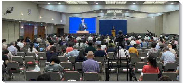
▲信基區夏季現場訓練於信基大樓主會場

經過訓練後，聖徒們不僅被加強與拔高，且對神永遠的經綸有更清楚的異象，進一步認識神今時代的需要，看見我們需要從世界中出來，進入時代的職事，並立志成為得勝者，成為有活力的人，而能轉移時代，好迎接主的再來。（黃昱樹）