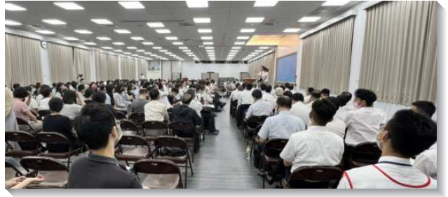
▲大安區夏季現場訓練於三會所舉行

第六篇至第九篇，說到我們的召會生活需要從帳幕的召會生活往前到殿的召會生活，不僅是地點的移動，更是在材料上、尺寸上、榮耀上都要大大的往前，使我們