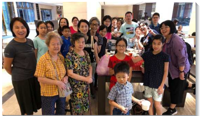
▲聖徒們各盡功用，增區成功

有的聖徒因長久配搭而捨不得分開，然而為著主的需要，願意受調整，不再照著天然揀選，猶如斷奶的嬰孩，乃照著帶領積極跟隨主，一同走出康莊大道。身在其中的弟兄姊妹都滿心喜樂，這實在不是人手所作的。宣告增區的時刻就在眼前，弟兄姊妹更是滿了信心，增區一定成功，感謝讚美主。（劉成舉）