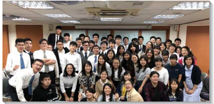
▲學生們出外擘餅聚會相調喜樂

為延續此負擔，在期中考後，我們再舉辦一次相調。十一月十八日主日當天，學生們至十九會所與當