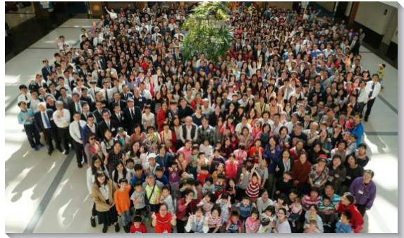
▲大安區聖徒參加感恩節特會與相調

週六相調活動內容十分豐富，依青少年、大專、青職、社區各專項分為四個行程。青年人同心合意，完成三索岩降、自力造筏。社區聖徒、親子走訪台中花博等景點。行程結束後，眾人再同赴中部相調中心參加福音聚會。過程中，我們享受基督作禧年和實際。聖徒們在活動中流露基督，成為福音聚會最好的見證，見證基督如何使我們虛空的人生變為詩歌，也邀約親友同來經歷這樣的生活。當晚，有兩位朋友在福