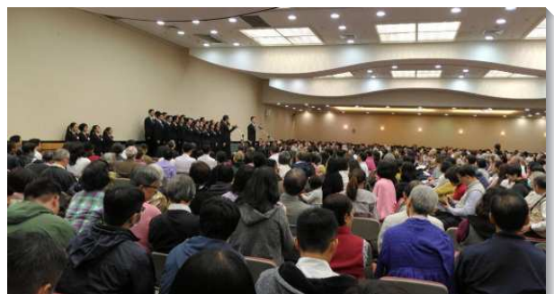
▲信基區感恩節特會，全時間學員展覽

每半年的集中主日聚會，不僅是為著真理的釋放，更將大區內九個會所相調在一起，並顧到新人的成全。讚美主將我們引進基督身體的實際。（陳一靈）